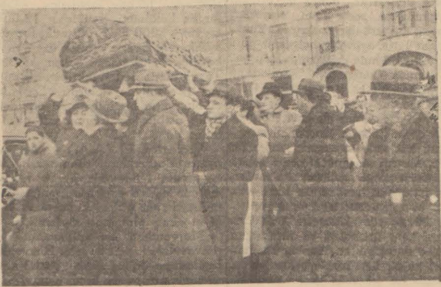
Refi Bayar merhumun cenazesi evinden çıkarılırken

Cenaze merasiminde Reiscümhur namına yaverleri, birçok yüksek zevat, vilâyet, belediye, parti, bankalar, şirketler erkânı ve kalabalık bir halk kütlesi hazır bulundu